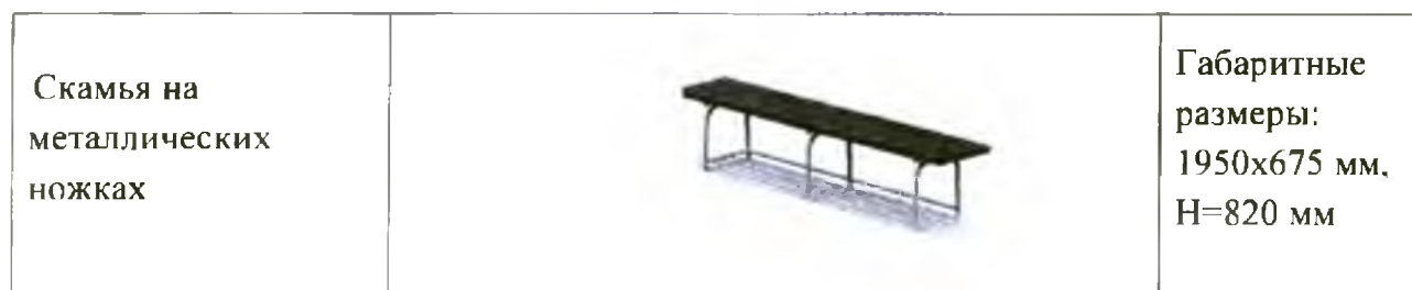
Таблица 2. Визуализированный перечень образцов элементов благоустройства, предлагаемых к размещению на дворовой территории многоквартирного жилого дома, сформированный исходя из минимального перечня работ по благоустройству дворовых территорий многоквартирных домов